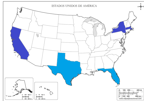
Figura 2. Distribución de migrantes del suroriente de Guatemala en Estados Unidos.

Para establecer por qué los guatemaltecos migran hacia Estados Unidos, se les preguntó a las familias establecidas en Guatemala los motivos que impulsaron a su pariente a irse. Como era de esperarse, de 606 personas, 409 indicaron que el principal motivo ha sido la falta de empleo. Sin embargo, 149 personas indicaron que su familiar tenía un trabajo en Guatemala, pero que al ver que muchas personas hacían su casa, negocio o adquirían bienes —como un vehículo— más