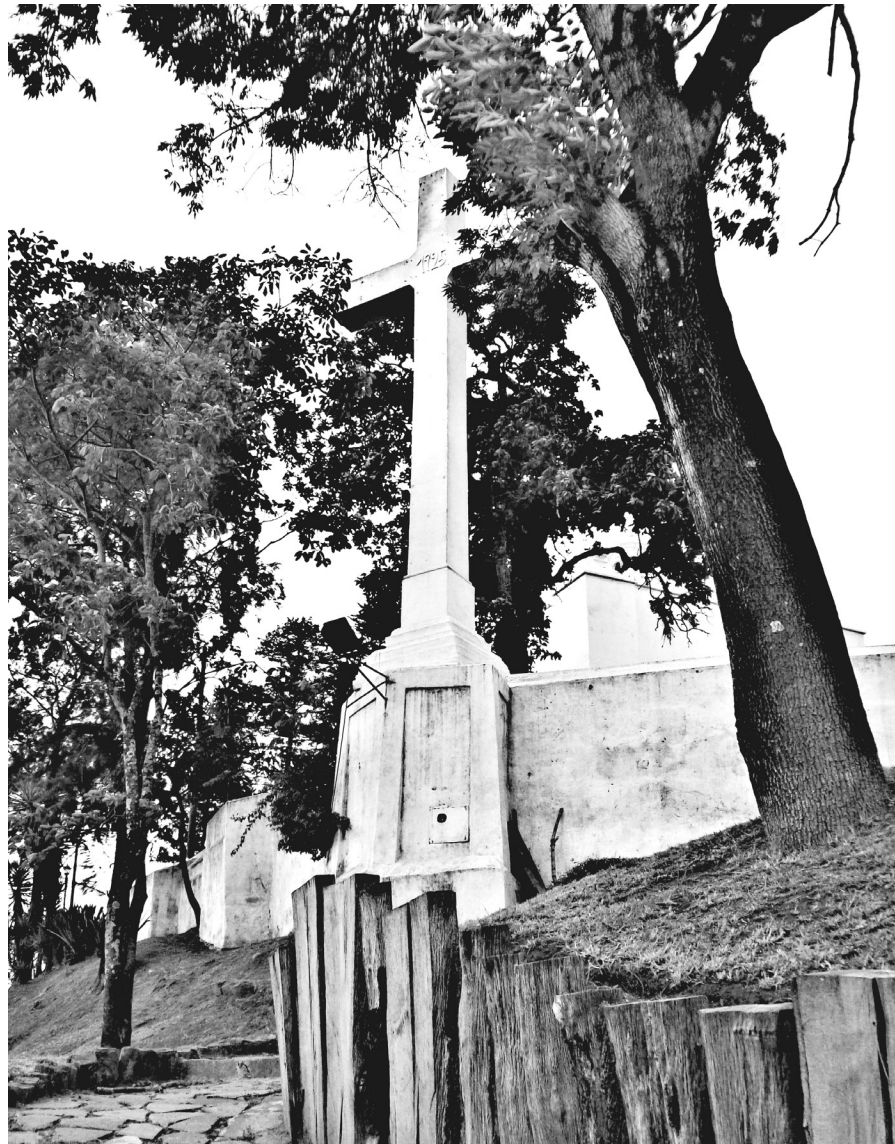
Figura 19. Cruz del Cerrito. Monumento en el Cerro del Carmen de la ciudad de Guatemala.