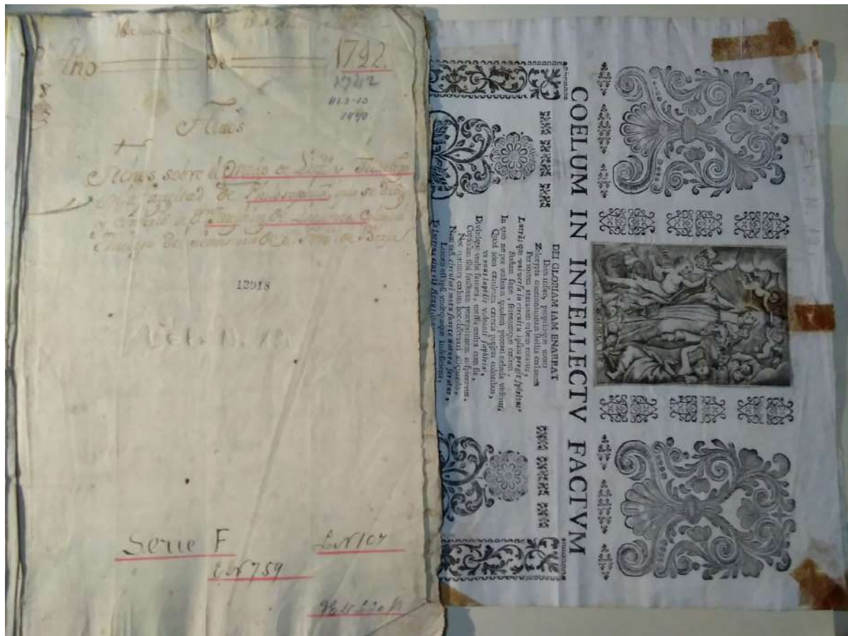
Figura 4. Expediente de Tarja MLA. T4 de Joaquín Lacunza y Bustamante del año 1742 (fotografía de L. M. Marroquín, realizada con la autorización del Ministerio de Cultura y Deportes).

XVIII y XIX, acerca de los requisitos para la obtención de grados de bachiller, licenciado, maestro y doctor en las distintas facultades (Sarasa y Arce, 1681). Figuras 4 y 5 y Tabla 3.