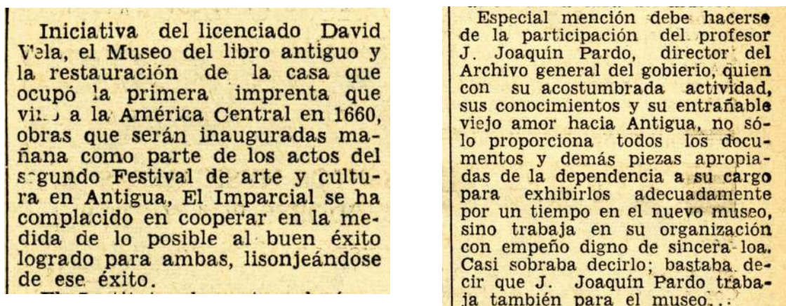
Figura 8. Fragmentos de la noticia, Inauguración del Museo del Libro publicada en el diario El Imparcial el día 15 de marzo de 1956. Una minuciosa revisión en esta colección, noticias y detalles sobre la inauguración del MLA.