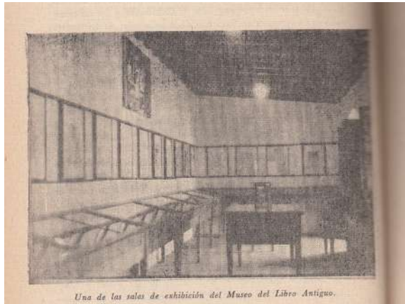
Figura 3. Nota. Fotografía de una sala de exposición en el Museo del Libro Antigo durante sus primeros años, nótese los marcos de madera con vidrio colocados en los muros. De “Catálogo del Museo del Libro Antigo” por M. Reyes, 1971, p.22 Guatemala: Editorial José de Pineda Ibarra.

grafía antigua que muestra una sección de la exposición de documentos en sus primeros años, en la cual es posible apreciar varios marcos de madera con vidrios colocados en los muros de una de sus salas. Se sabe por los inventarios, que tales marcos sirvieron para colocar grabados y tarjas universitarias (Figura 3).