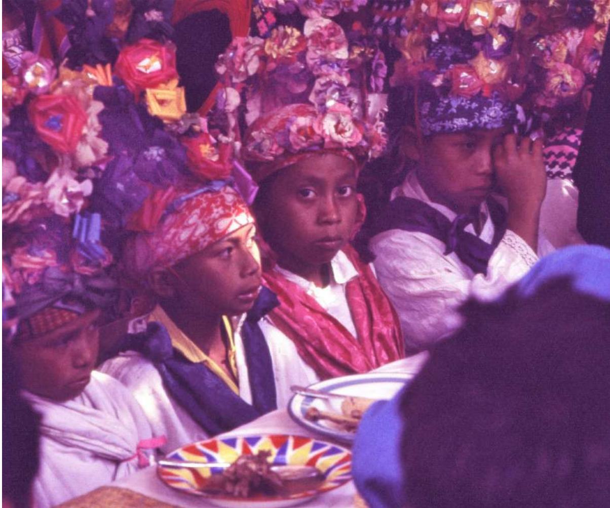
Figura 5. Los niños “apóstoles” esperan su comida ritual el domingo de Ramos.