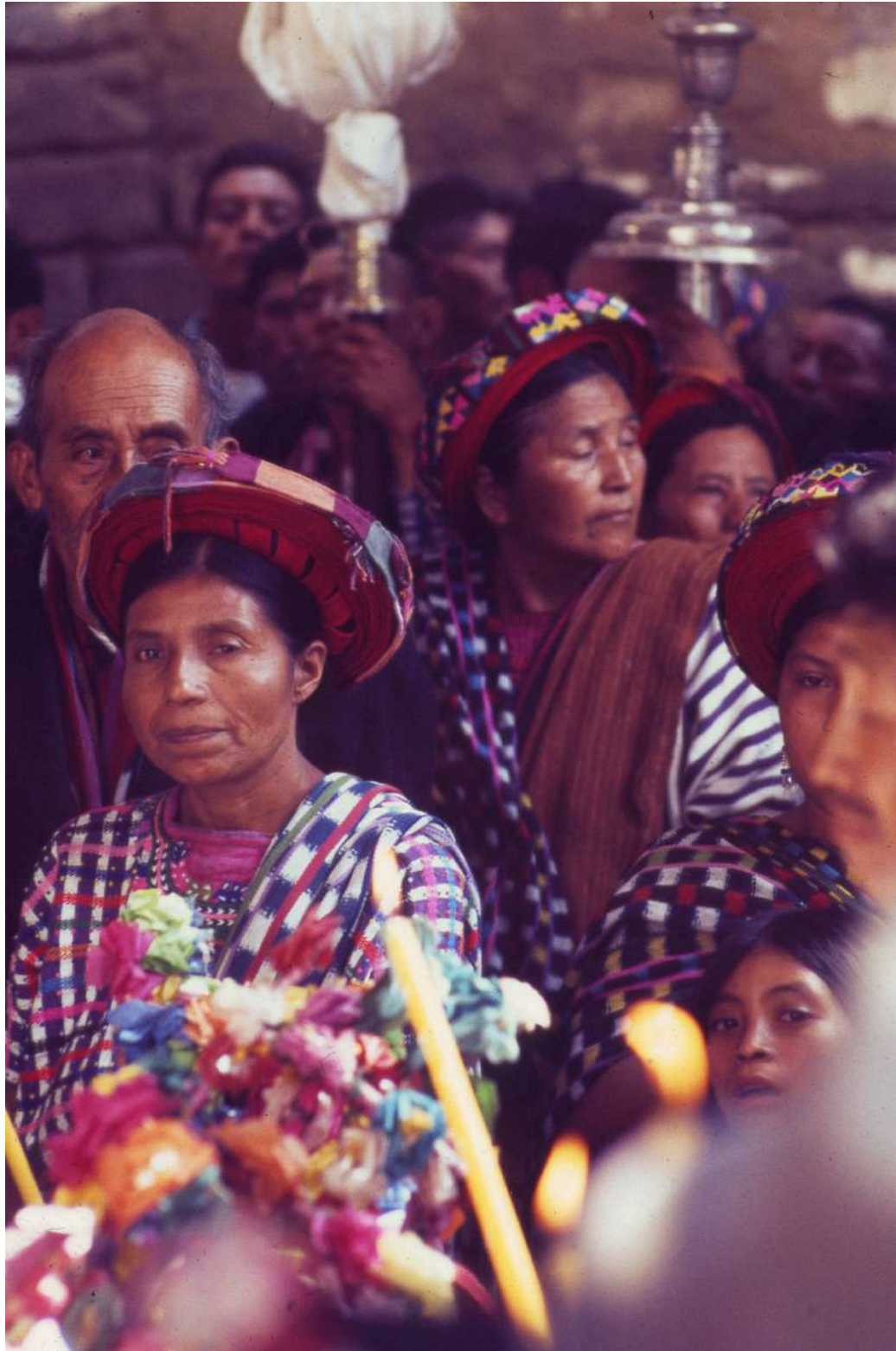
Figura 10. La gente se reúne en el templo.