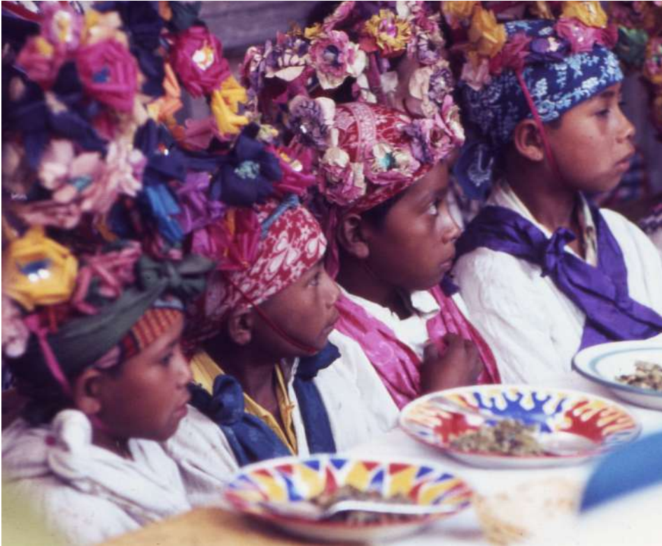
Figura 8. Los niños “apóstoles” esperan su comida.