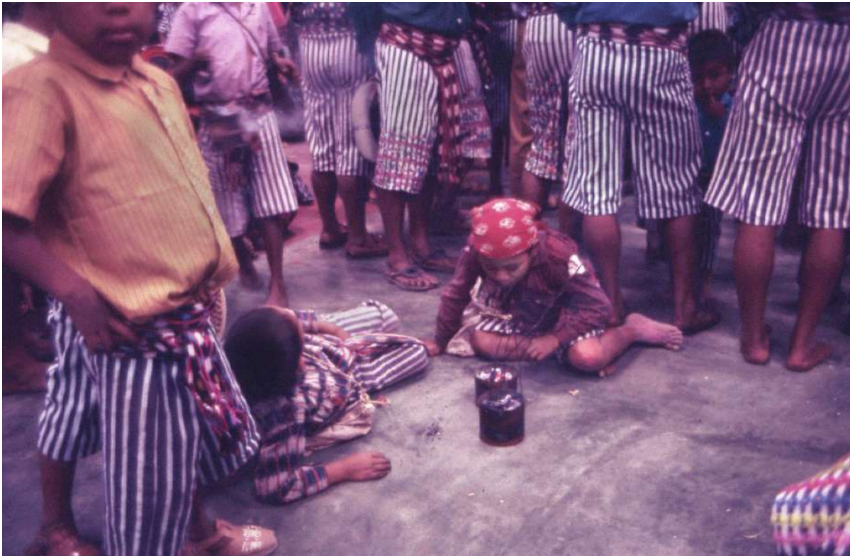
Figura 12. Mientras otros niños se entretienen durante la misa.