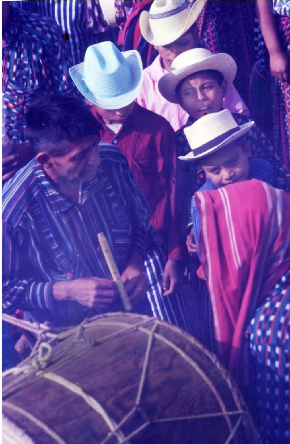
Figura 2. Procesión del Domingo de Ramos, donde va primero el tamborón.