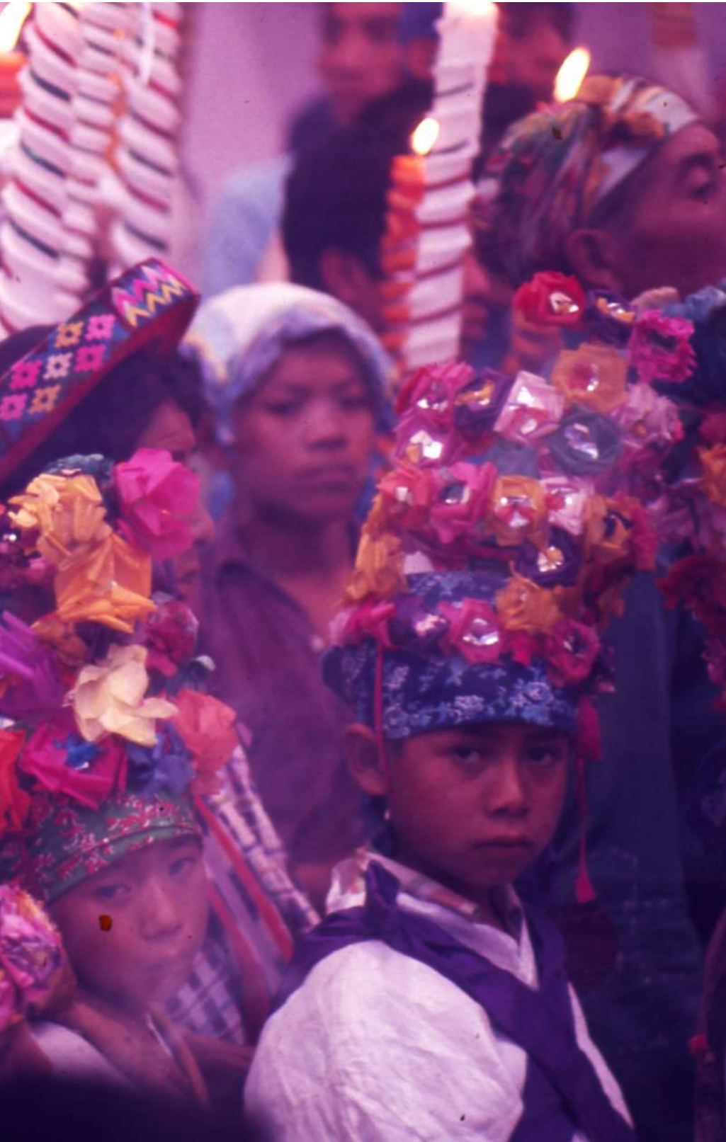
Figura 14. Entre la multitud los niños sacristanes con sus tocados.