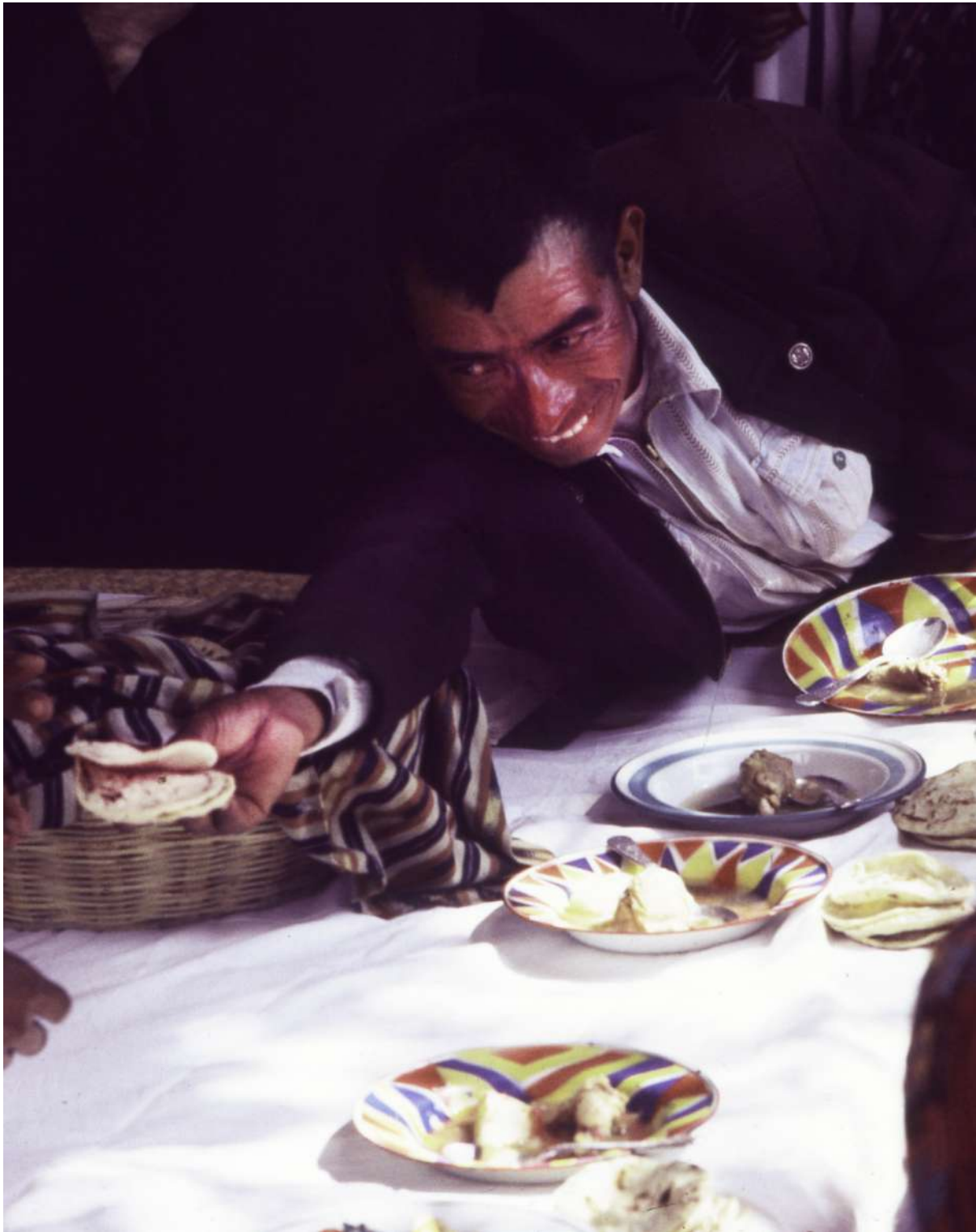
Figura 7. Un sacristán sirve las tortillas en la comida del domingo de Ramos.