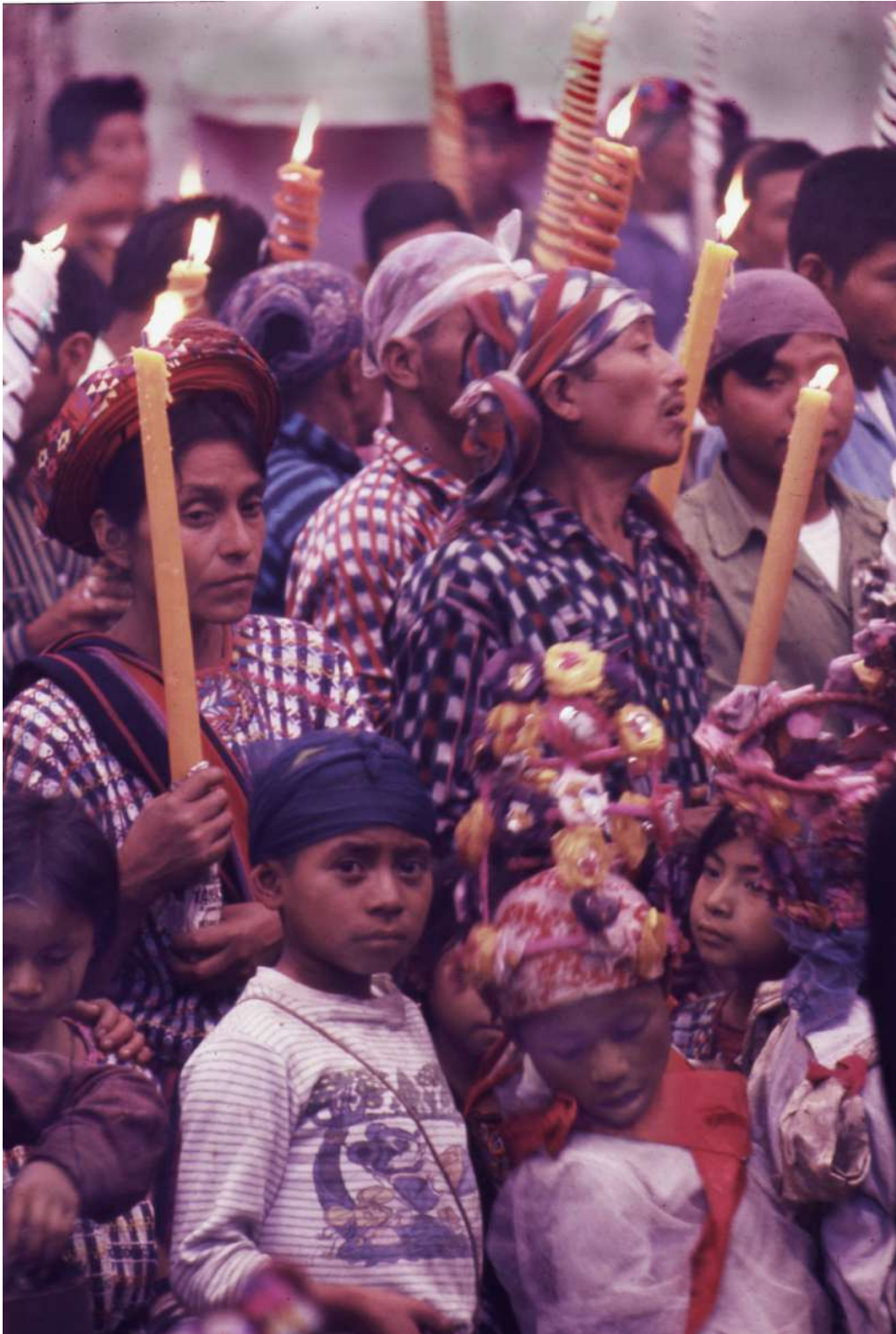
Figura 11. Los niños sacristanes durante la misa entre los asistentes.