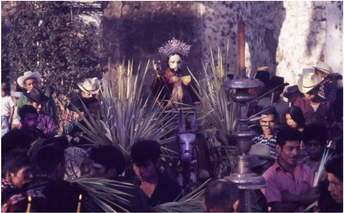
Figura 3. El pueblo acompaña al Señor del Domingo Ramos, montado en su burro, en la procesión hacia el templo.