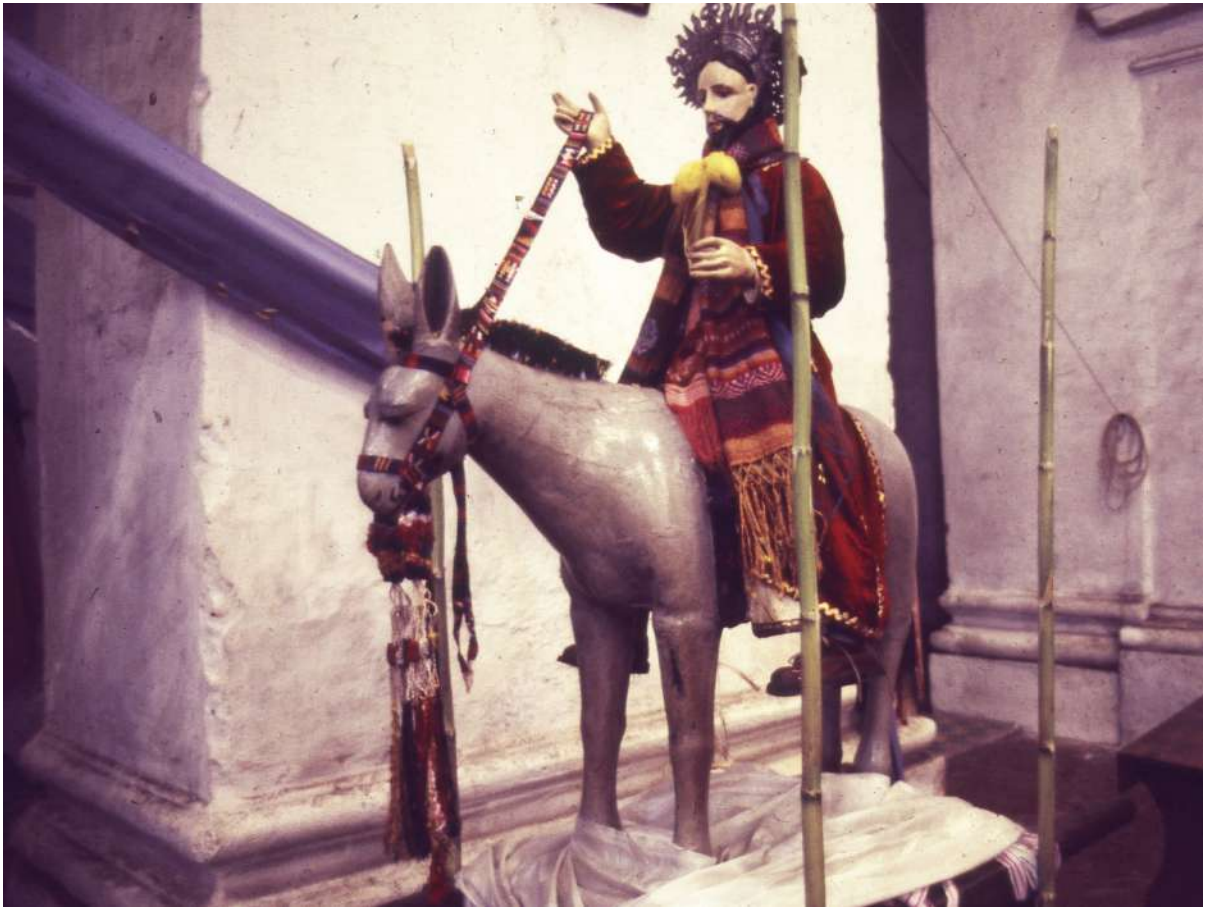
Figura 1. Imagen del Señor del Domingo Ramos en el templo.