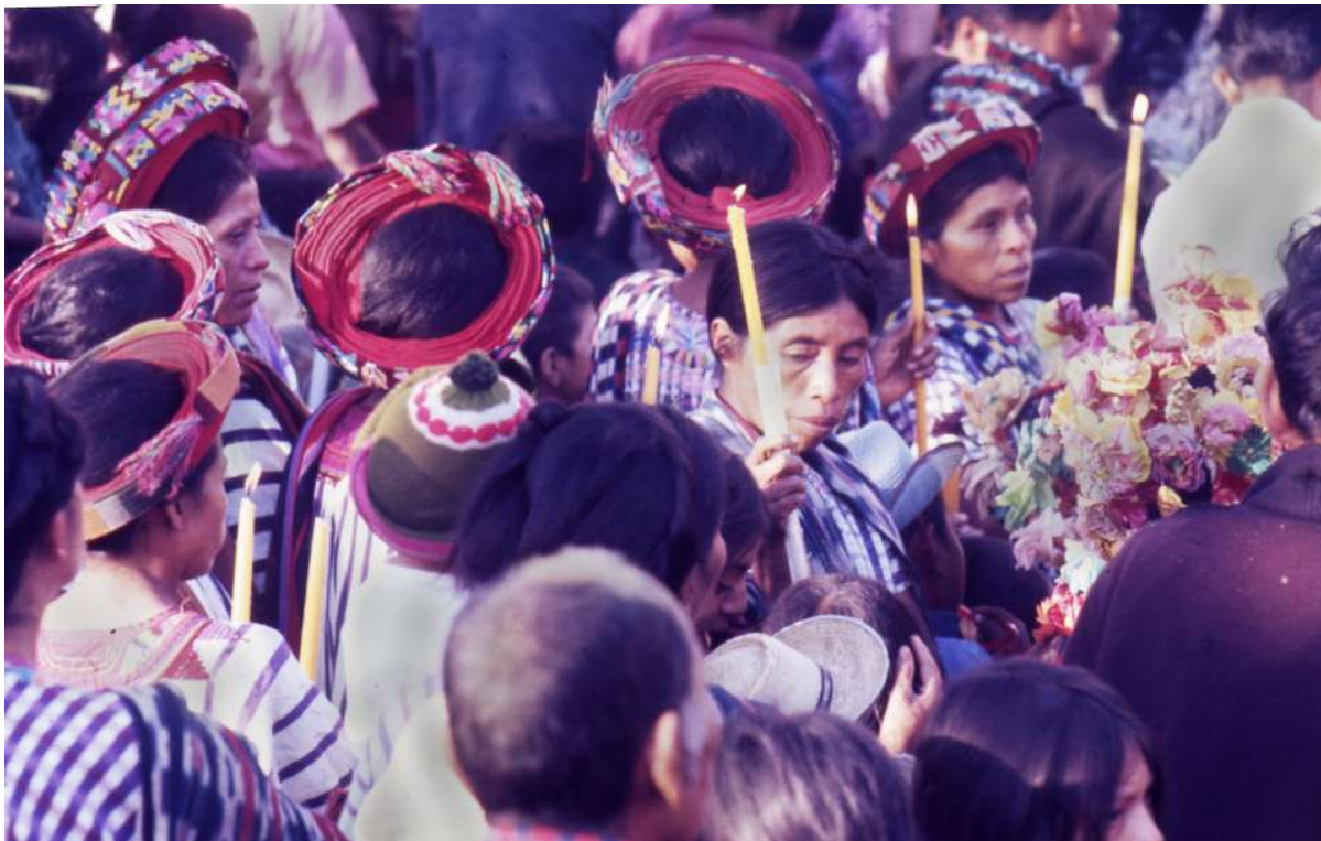
Figura 13. La participación femenina es central.