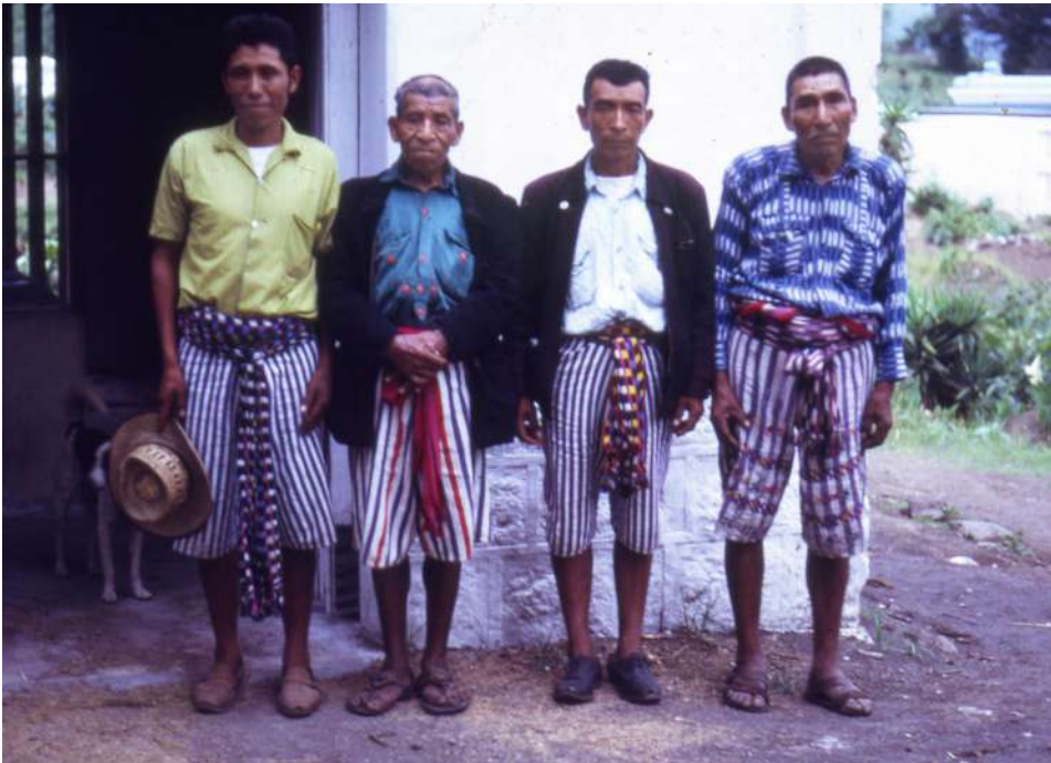
Figura 9. Los sacristanes del año 1972.