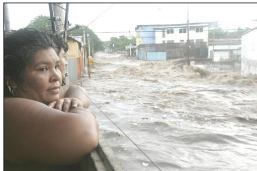
Figura 3: Inundación urbana de San Salvador

Es importante aclarar que en los últimos años, las inundaciones se han incrementado en el país debido a diversos factores: incremento de urbanizaciones y cambio de uso de suelo de las partes altas de las cuencas, ubicación de asentamientos humanos sin control ni ordenamiento en áreas y planicies de inundación, pérdidas de suelo e incremento de erosión por la deforestación, mal manejo de las cuencas, pobre planeamiento urbano y aumento de los asentamientos humanos, así como cambios en la distribución temporal y espacial de las lluvias.