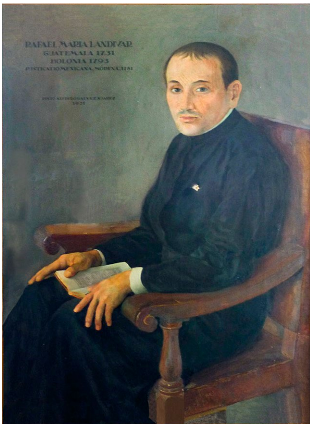
Rafael Landívar, óleo sobre lienzo por Alfredo Gálvez Suárez (1931). Museo de la Universidad de San Carlos de Guatemala.